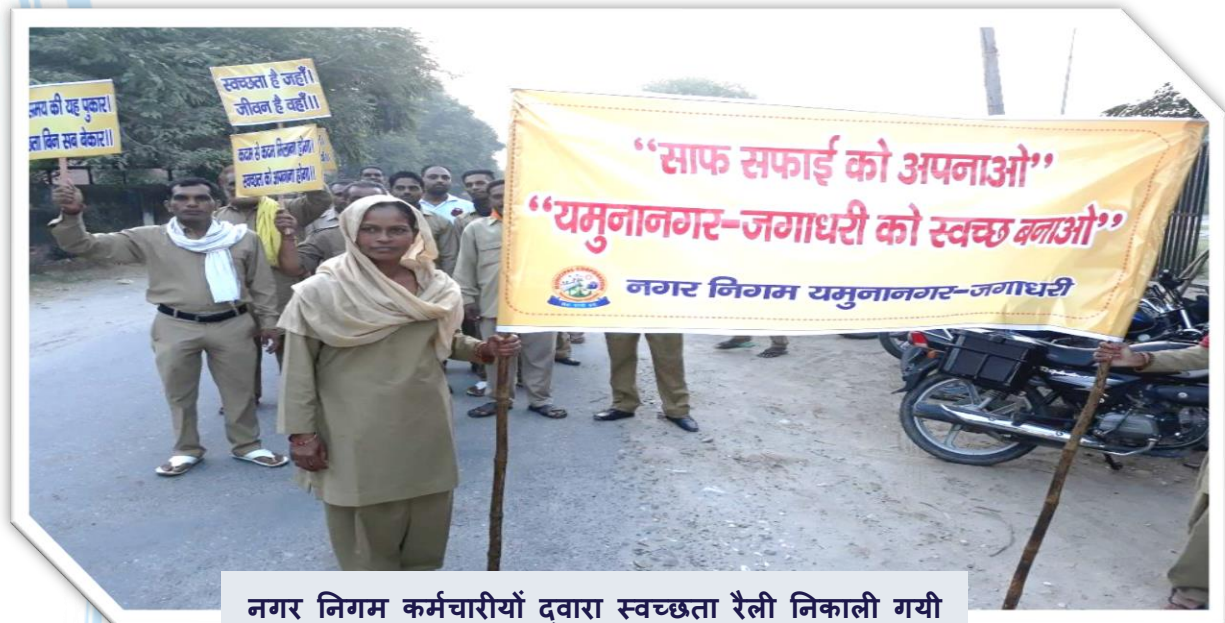
नगर निगम कर्मचारीयों द्वारा स्वच्छता रैली निकाली गयी

हमें गंदगी और खुले में शौच के खिलाफ लड़ाई लड़नी है, हमें पुरानी आदतों को बदलना है और महात्मा गांधी जी की 150वीं जयंती के वर्ष 2019 तक स्वच्छ भारत का लक्ष्य प्राप्त करना है। हमारे गावों में महिलाओं का गौरव एक महत्वपूर्ण विषय है, इस के लिए हमें एक जुट हो कर चलना होगा। ...प्रधानमन्त्री श्री नरेन्द्र मोदी