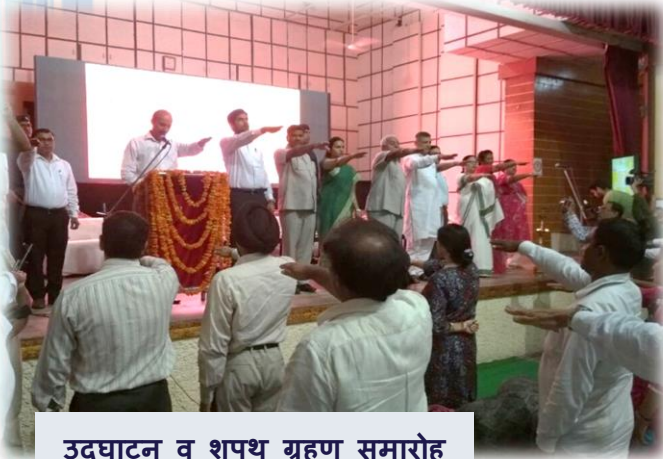
उद्घाटन व शपथ ग्रहण समारोह

महात्मा गांधी जी का सपना था कि हमारा भारत देश स्वच्छ व निर्मल हो, प्रधानमंत्री श्री नरेंद्र मोदी ने उनके इस सपने को पूरा करने के लिए स्वच्छता अभियान के अंतर्गत "स्वच्छता ही सेवा" पखवाडा चलाया. नगर निगम यमुनानगर-जगाधरी व यमुनानगर जिलावासियों का इसमें भरपूर योगदान रहा।