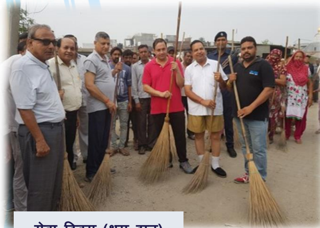
सेवा दिवस (श्रम दान)